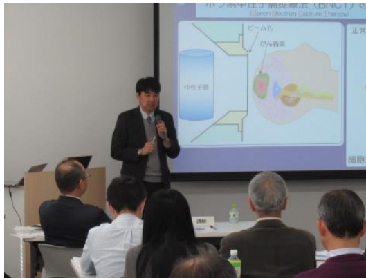
講演の様子（熊田先生）