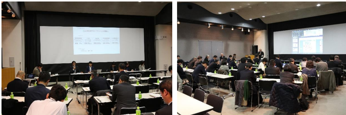
合同連絡会の様子