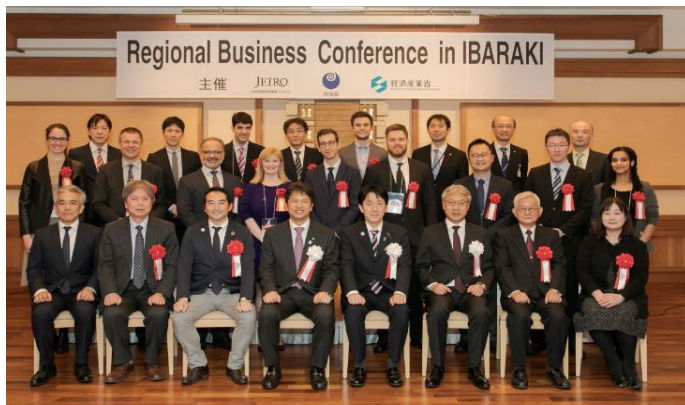
対日直接投資カンファレンス主要参加者

また、平成31年2月19日（火）～20日（水）に茨城県が主催した対日直接投資カンファレンス（RBC：Regional Business Conference in IBARAKI）では、つくばライフサイエンス推進協議会（TLSK）（後述）に協力を依頼し、海外招聘企業の選択やTLSKメンバーからのRBCへの招聘等により、茨城県グローバル戦略チームの支援を行った。