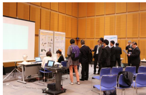
TIA-TLSK WS ショートプレゼンの様子