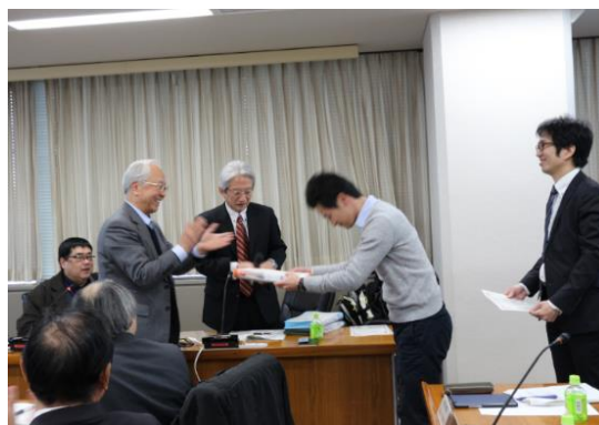
テーマ提案に対する表彰式