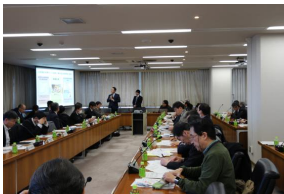
若手交流会のチーム発表会

若手研究者の横のつながり形成や、次世代の共同研究テーマの発掘を目指して、つくばの様々な研究所の 40 歳以下の研究者による若手交流会を開催した。平成 30 年度は、これまで交流会で検討してきたテーマ候補 50 件から、“見える化 1”、“見える化 2”、“培養肉”のテーマを選定し、各チームに分かれて、講師の指導のもと、計 5 回 (6/6、7/11、9/7、11/14、12/13) の若手交流勉強会を実施した。各チームのテーマ検討の結果は、第 33 回 TLSK で、会員への新規テーマ提案として発表し、それぞれ表彰された。なお、テーマ“培養肉”に関して、TLSK 若手交流会発の事業化候補テーマとして採択され、来年度の生物医学資源コンソーシアムテーマ候補として検討されている。