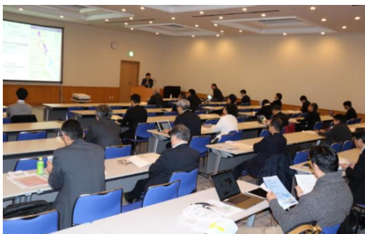
TIA-TLSK ライフイノベーションワークショップ