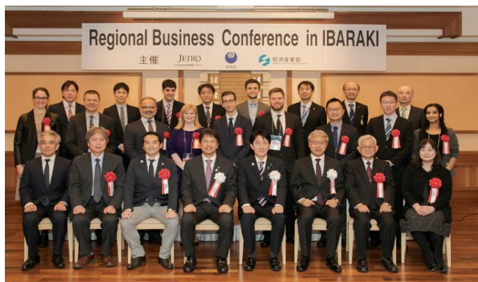
対日直接投資カンファレンス主要参加者

また、平成31年2月19日（火）～20日（水）に茨城県が主催した対日直接投資カンファレンス（RBC：Regional Business Conference in IBARAKI）では、つくばライフサイエンス推進協議会（TLSK）（後述）に協力を依頼し、海外招聘企業の選択やTLSKメンバーからのRBCへの招聘等により、茨城県グローバル戦略チームの支援を行った。