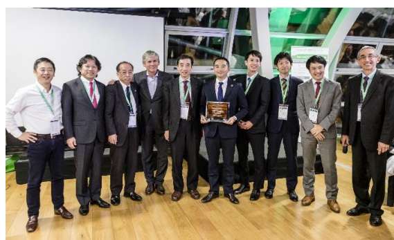
特別賞を授与されたつくば地域の代表団