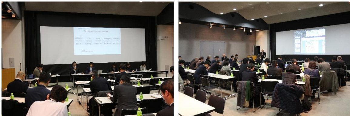
合同連絡会の様子