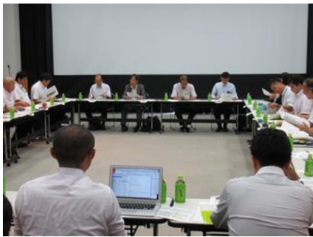
合同連絡会の様子