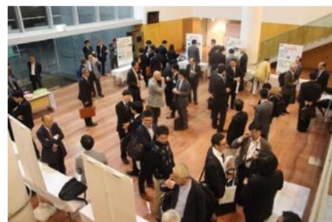
ポスターセッションの様子