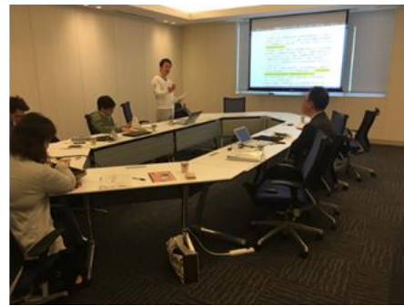
JST/NIMS 個別相談会の様子