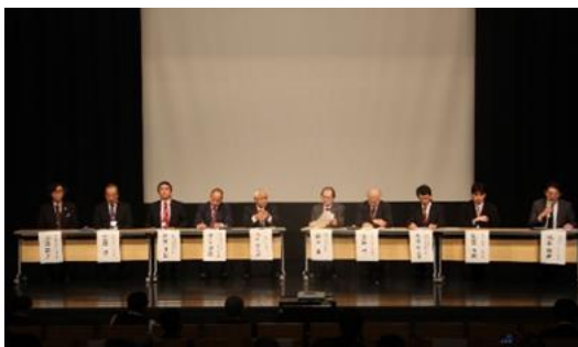
パネルディスカッションの様子