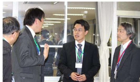
情報交換会の様子