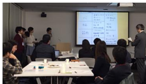
TLSK 若手交流会の様子